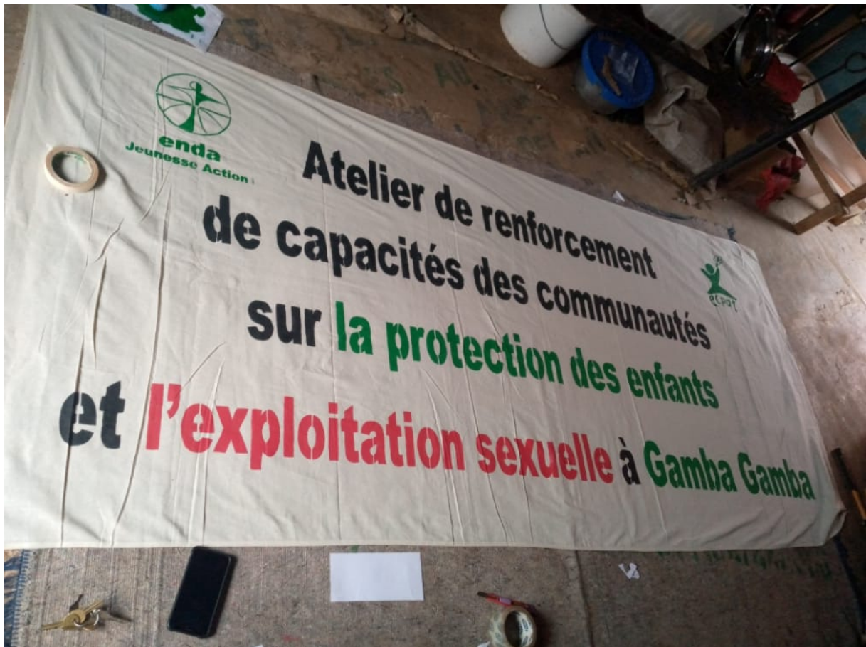
Sensibilisation des populations sur la traite et l'exploitation sexuelle des enfants